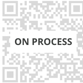
SERTIFIKAT BADAN USAHA JASA KONSTRUKSI