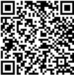
AKTA PENDIRIAN PERUSAHAAN